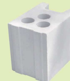
PREBET SILIKAT N18 DR