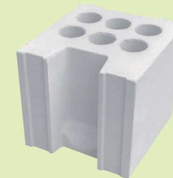
PREBET SILIKAT N24 DR / N25 DR