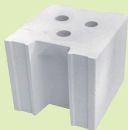
PREBET SILIKAT N24 DR3 / N25 DR3