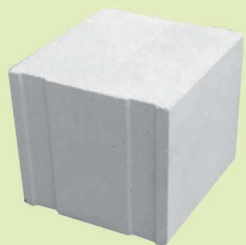
PREBET SILIKAT A24 P