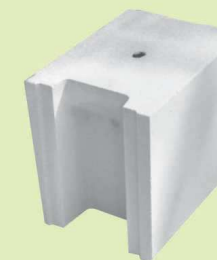
PREBET SILIKAT N18 PW