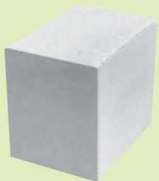
PREBET SILIKAT N18 AKU