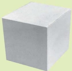
PREBET SILIKAT N24 AKU